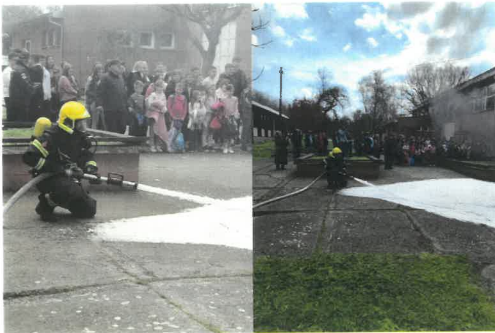
23.мај 2025. Добровољно ватрогасно друштво Параћин на здруженој вежби са ВСЈ Параћин, ВСЈ Јагодина, ватрогасцима цементаре као и Црвеним Крстом Параћин у фабрици цемента Моравацем.