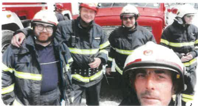
Paraćinski vatrogasci u borbi sa letnjim požarima